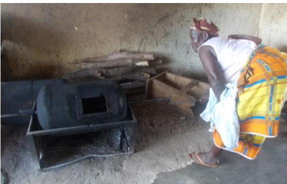
Herstellung von Shea-Butter für Seife u.a.